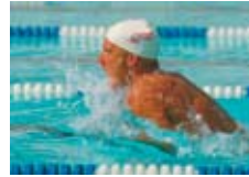
Sem tecnologia Color HD

Exclusiva tecnologia HD Color (Alta Definição) – Proporcionando uma qualidade de impressão que destaca visivelmente os seus documentos, a tecnologia HD Color oferece resultados excelentes.