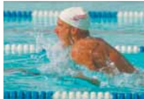
Com a tecnologia HD Color

Os modelos da Série C830 equipados com o disco rígido 1 possuem recursos avançados de segurança.