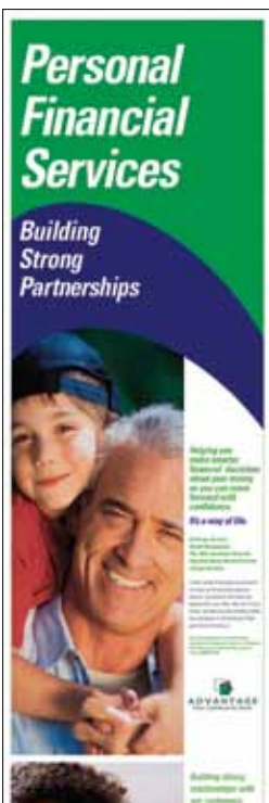
297 x 120 cm / Banner