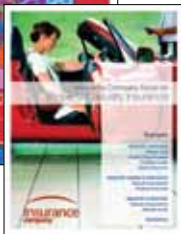
21,5 x 29,7 cm Carta