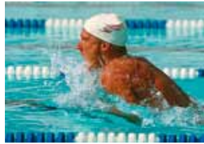
Sem a tecnologia HD Color

Exclusiva tecnologia HD de impressão em cores – para uma qualidade de impressão que realça visivelmente os seus documentos. A tecnologia HD Color combina os pentes de LED em múltiplos níveis, o exclusivo toner microfino com uma resolução de 1200 x 600 dpi, proporcionando maior riqueza de detalhes e cores, além de um acabamento brilhante, mesmo em papéis comuns.