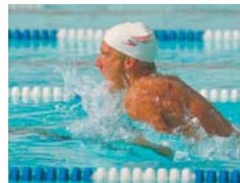
Sem a tecnologia HD Color