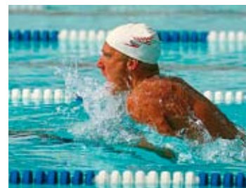
Com a tecnologia HD Color

Juntamente com a resolução de 1200 x 600 dpi, a tecnologia de impressão colorida HD da impressora colorida digital C3600n oferece cores e detalhes mais precisos, bem como um acabamento com mais brilho, mesmo em papéis comuns