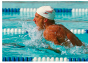
Con Tecnología de Color HD

Tecnología de Impresión a Color en Alta Definición (HD). Para obtener calidad que mejora visiblemente sus documentos, la tecnología de Color HD combina los cabezales de impresión LED multinivel de OKI Printing Solutions con tóner microfino y una resolución de 1200 x 600 ppp para lograr mayor profundidad y detalle en el color y un acabado brillante, incluso en papel de oficina ordinario.