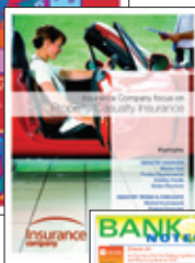
21.59 cm x 27.94 cm Carta