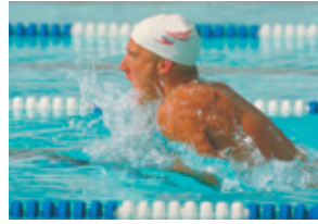
Sin Tecnología de Color HD

La Serie C830 cuenta con disco duro opcional de 40 GB y con características adicionales de seguridad que incluyen: