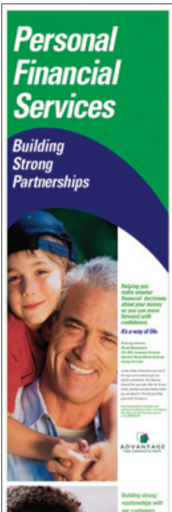
29.4 cm x 132 cm Banderín